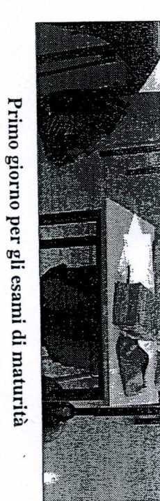
Primo giorno per gli esami di maturità

scritti di italiano, seguito dalla materia di indirizzo differente per ciascuna scuola e dai test di cultura generale. Il tutto ovviamente seguito dall'interrogazione orale.